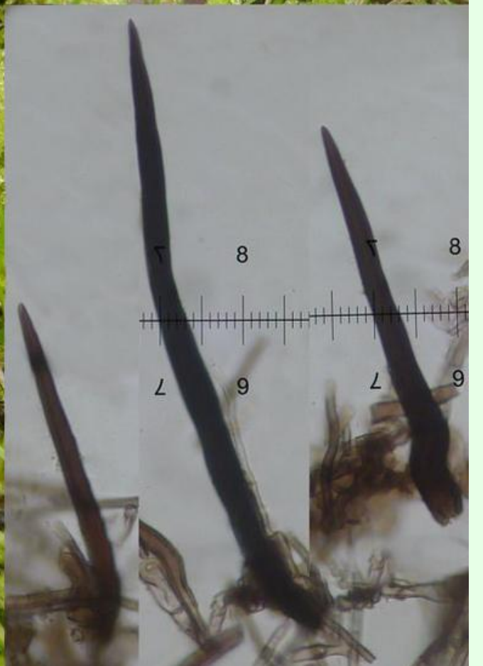
île d'Aix, déc. 2014