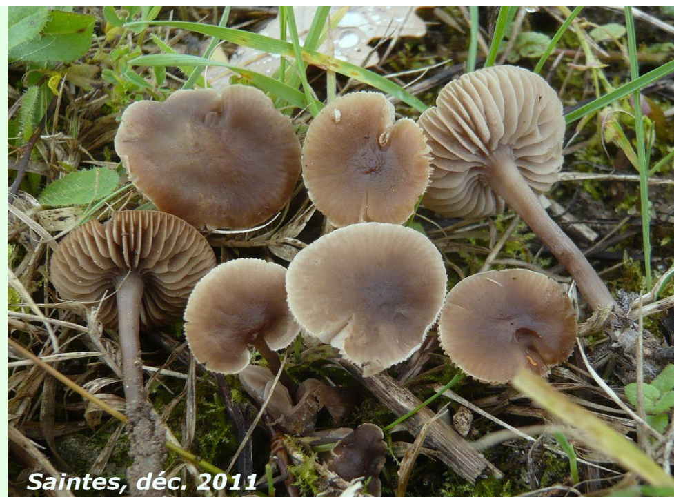
Saintes, déc. 2011