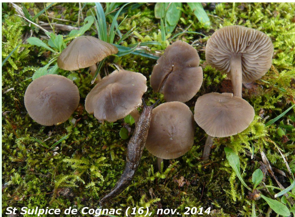
St Sulpice de Cognac (16), nov. 2014