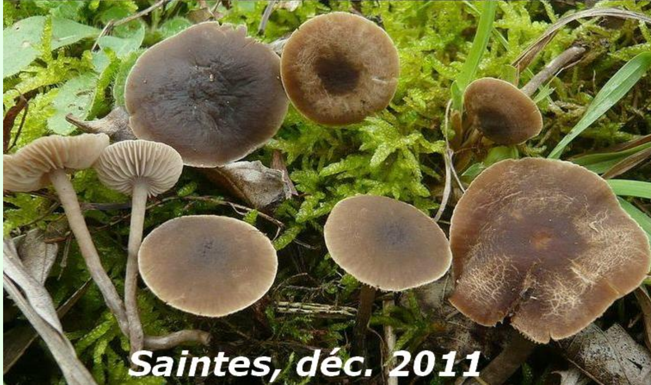
Saintes, déc. 2011