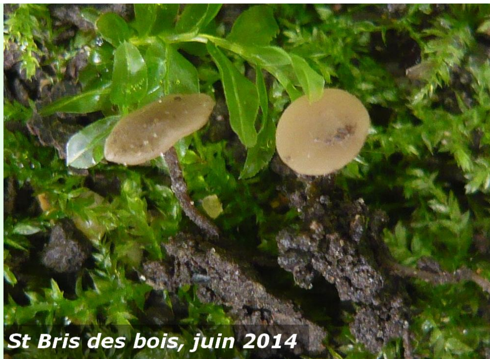
St Bris des bois, juin 2014