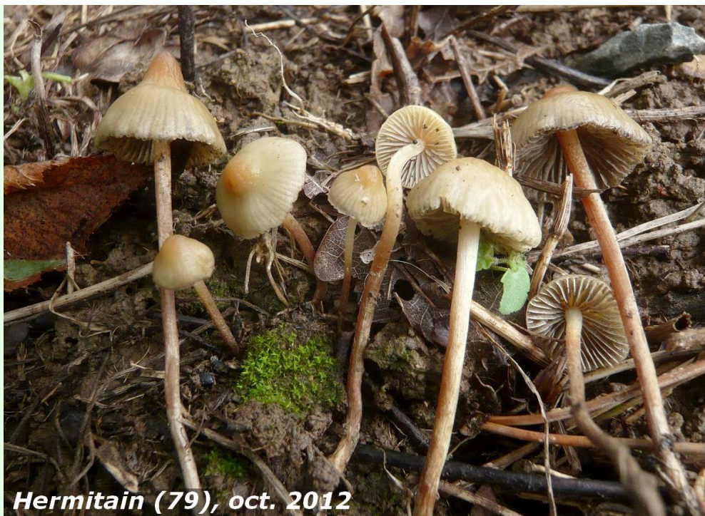
Hermitain (79), oct. 2012