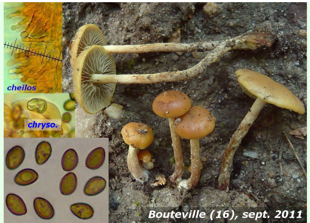
Bouteville (16), sept. 2011