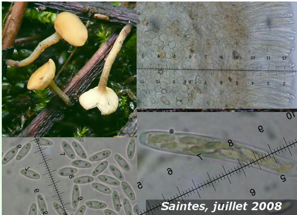
Saintes, juillet 2008