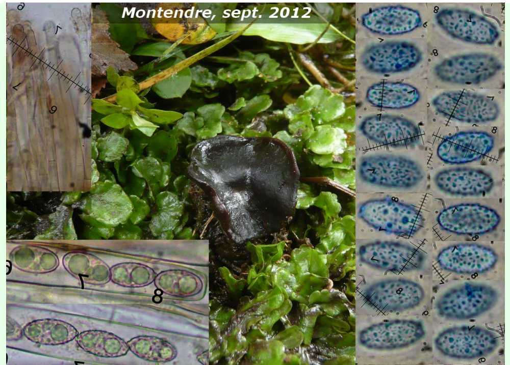
Montendre, sept. 2012