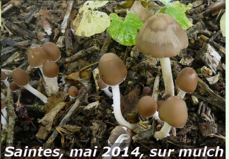
Saintes, mai 2014, sur mulch