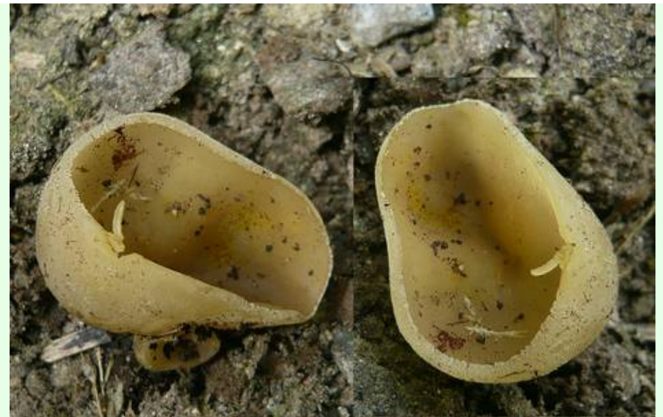
Juin 2008, au sol parmi des morceaux de bois