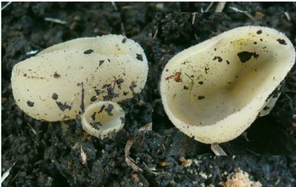
Juin 2008, au sol parmi des morceaux de bois