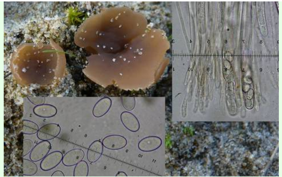
Décembre 2008, dans la dune à La Pointe Espagnole