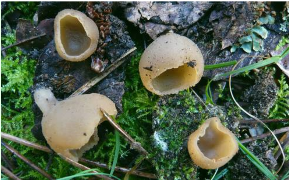
Février 2008, sur bord de route sous pins et chênes verts