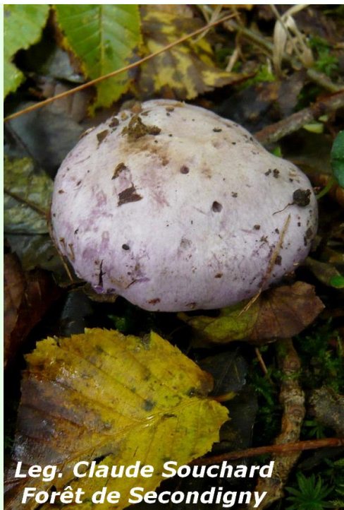
Leg. Claude Souchard Forêt de Secondigny