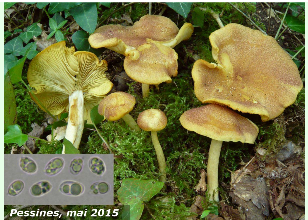
Pessines, mai 2015