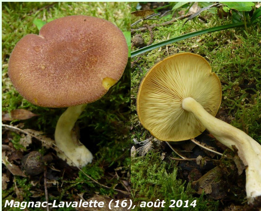
Magnac-Lavalette (16), août 2014