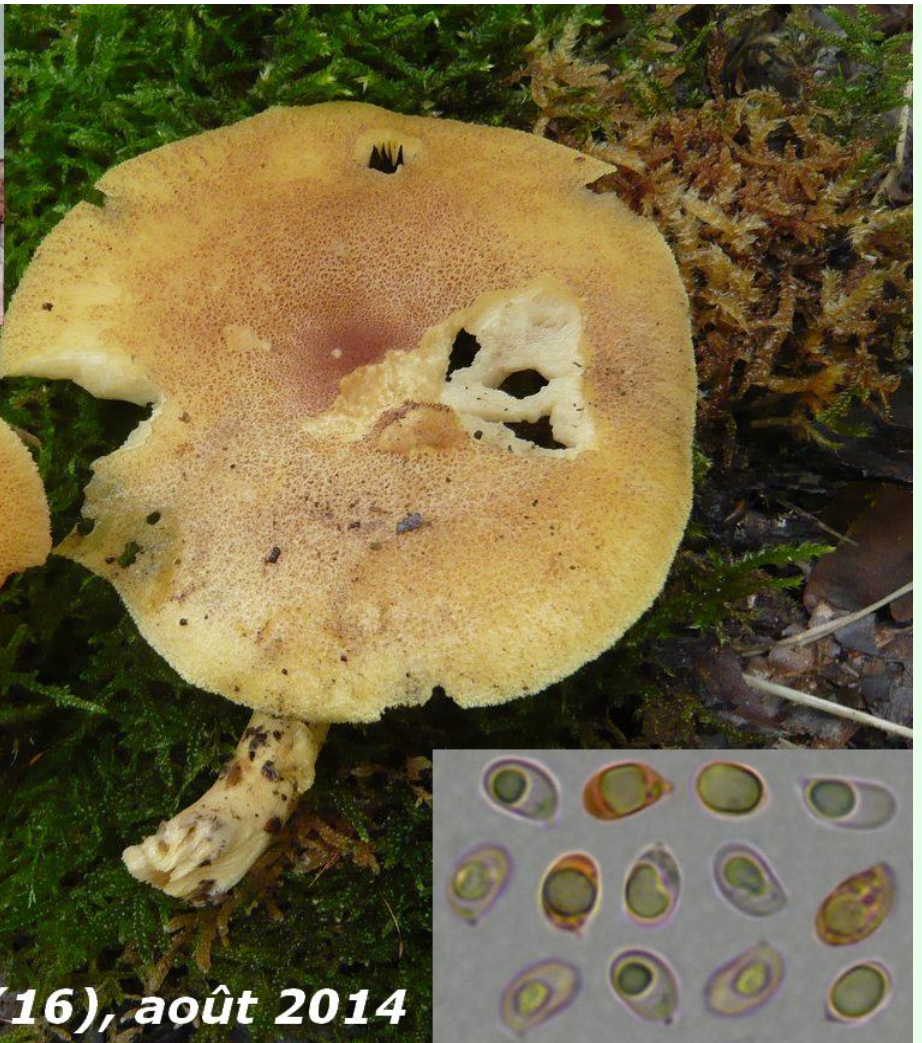
Magnac-Lavalette (16), août 2014