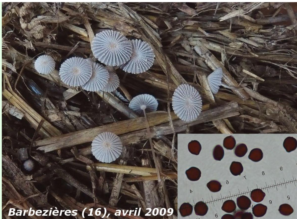
Barbezières (16), avril 2009