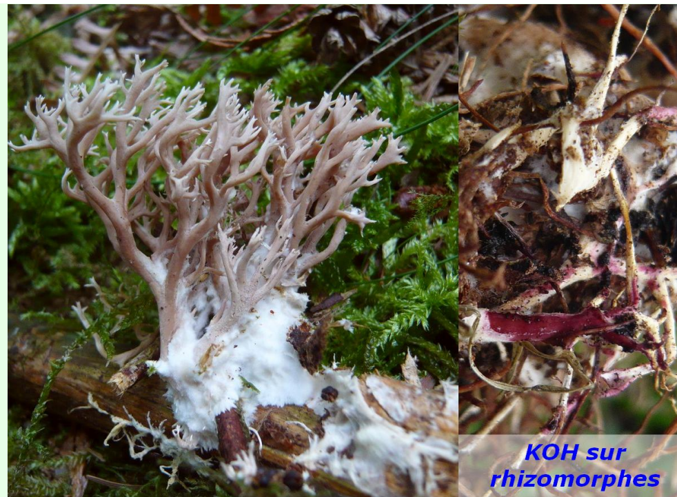
KOH sur rhizomorphes