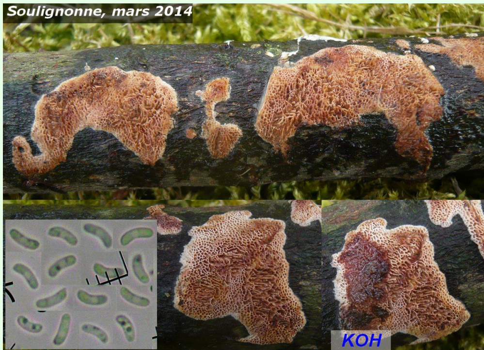
Soulignonne, mars 2014