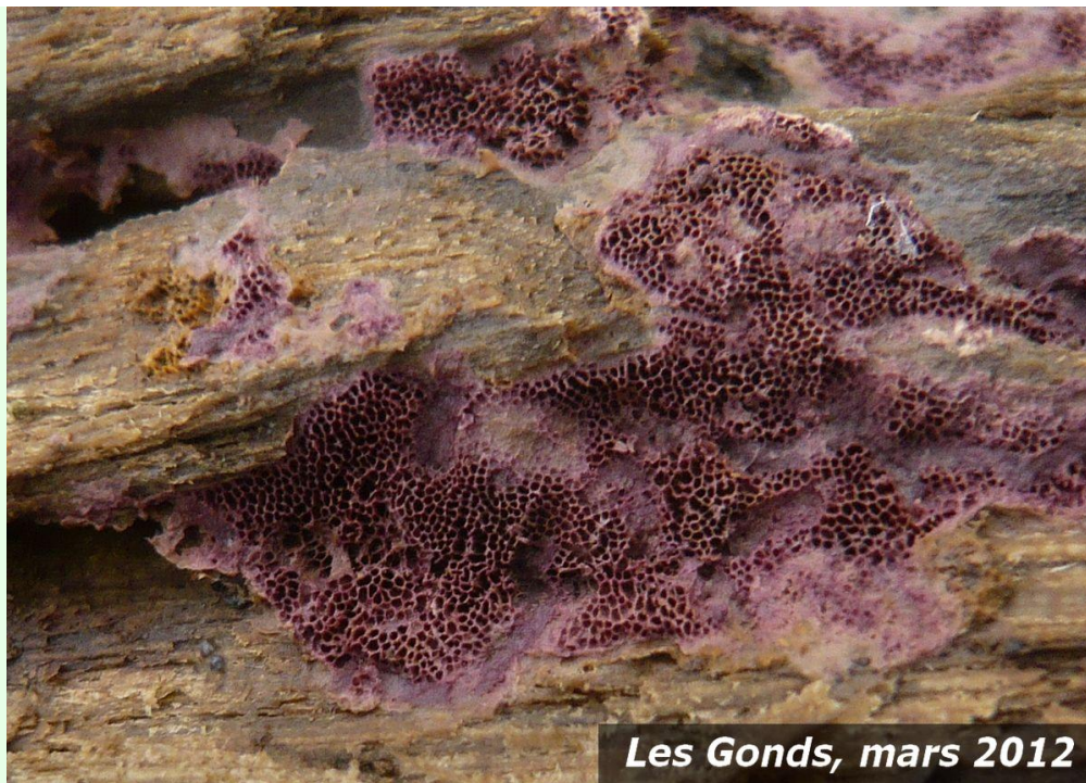
Les Gonds, mars 2012