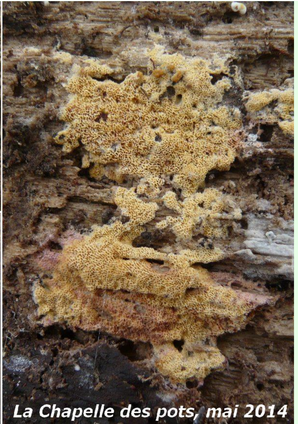
La Chapelle des pots, mai 2014